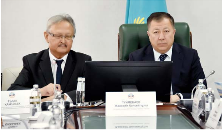
Соңы. Басы 1-бетте

Сондықтан деңгей-деңгеймен оқытуды қолға алғанымыз абзал. Шетелдіктерді оқытқан кезде де солай қабылдауымыз керек. Демек, бұрынғы жүйеден құтылған жөн. Кезінде мен осы деңгей бойынша оқыту жүйесіне оқулық дайындауға тапсырма бергенмін. Бірақ бәріміз жан-жаққа кеткеннен кейін ол аяқсыз қалды. Міне, бұл орынды көтерілген, өте дұрыс мәселе. Осының бәрін қолға алатын уақыт келді.